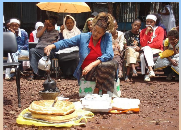
Op zorgvuldige wijze wordt de koffie gemalen, gezet, geschonken en geserveerd

De nadruk ligt hierbij op het samen in gesprek zijn over een positief leven. CFP ondersteunt deze gesprekken vanuit hun eigen visie. Want het is zo ontzettend belangrijk dat deze mensen weer perspectief en hoop krijgen, ook al is hun situatie soms schrijnend.